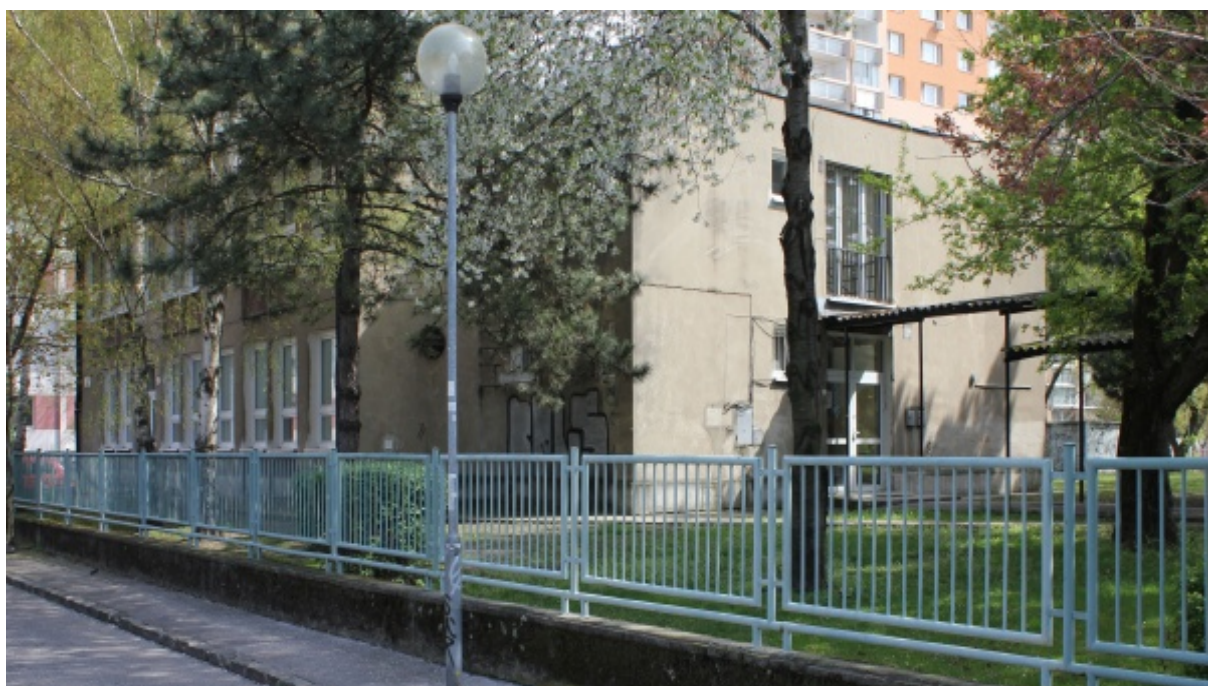
budova súpisné číslo 97 – školský pavilón „B“